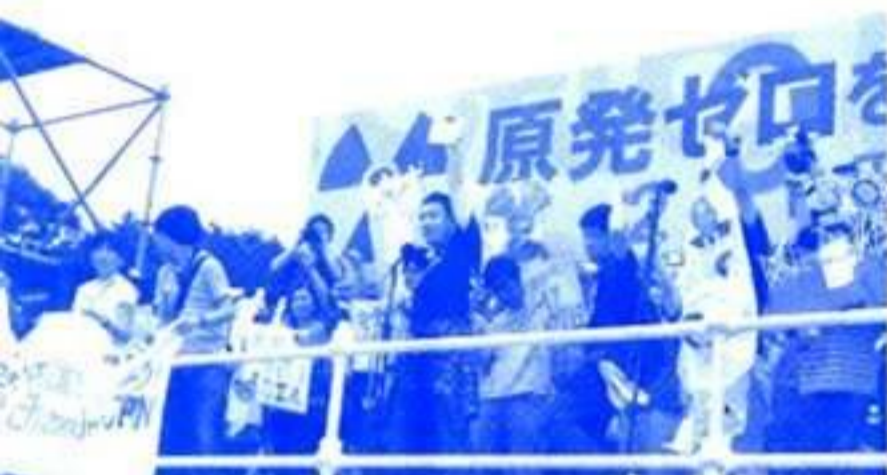
2011.7.2 原発ゼロをめざす7・2緊急行動