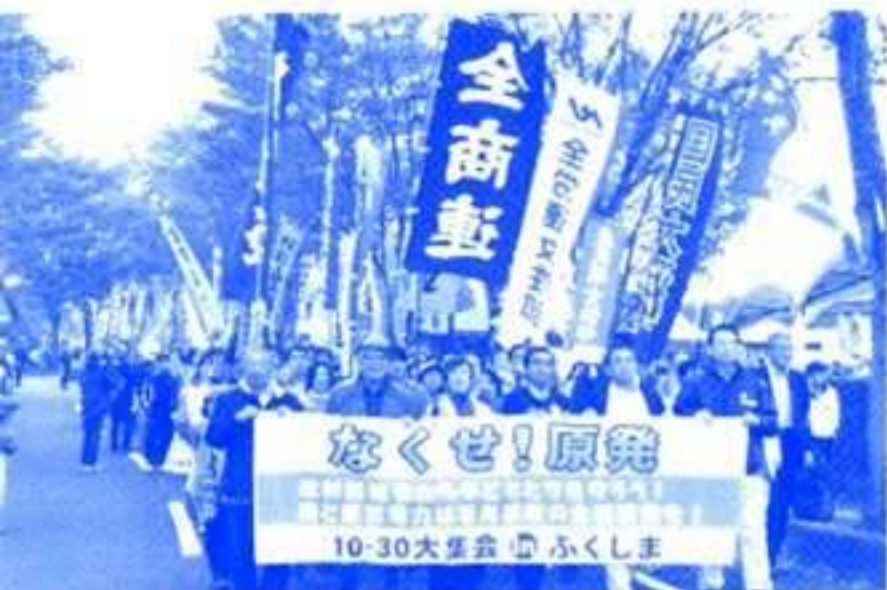
2011.10.30 なくせ原発 10・30大集会 | Nふくしま