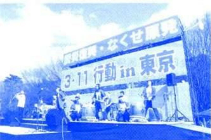
2012.3.11 震災復興・なくせ原発 3・11 行動 in 東京

政府は16日、原発再稼働問題の関係閣僚会合を開き、関西電力大飯原発3、4号機の再稼働を決定しました。国会事故調査委員会での福島原発事故の検証も途上で、まともな原子力規制機関も設置されておらず、原子炉メーカー任せのストレステストや暫定的な安全基準を根拠とする無謀きわまりない決定です。